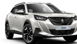
M6N9 | Pearl White (valkoinen)