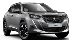
M0F4 | Artense Grey (harmaa)