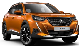
M02S | Orange Fusion (oranssi)