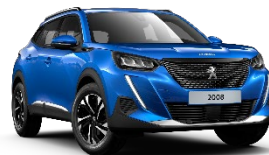
M6SM | Vertigo Blue (sininen)