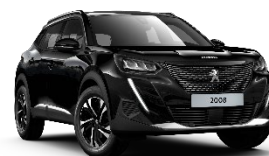
M09V | Perla Nera Black (musta)