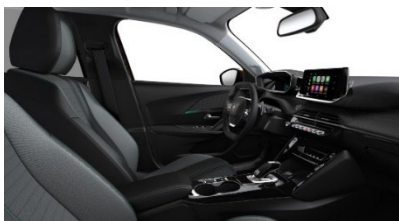
A6FX | Allure Pack