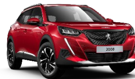
M5VH | Elixir Red (punainen)