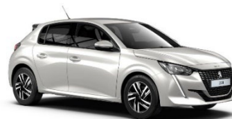
M6N9 | Pearl White (valkoinen)