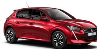
M5VH | Elixir Red (punainen)