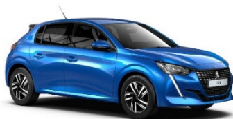
M6SM | Vertigo Blue (sininen)