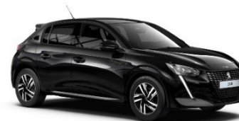
M09V | Perla Nera Black (musta)