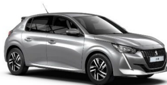
M0F4 | Artense Grey (harmaa)