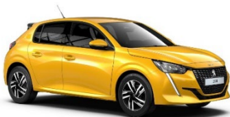
M02T | Faro Yellow (keltainen)