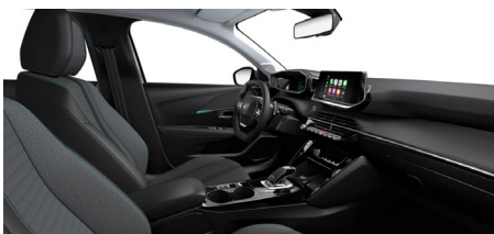
A6FX | Cosy | Allure Pack