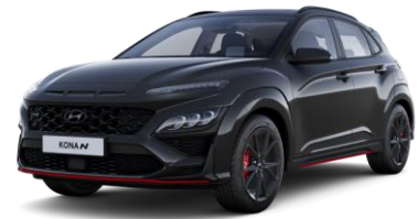
Phantom Black (MZH) helmiäisväri