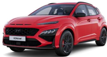
Ignite Flame (WR7) ilman lisähintaa