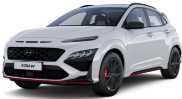
Sonic Blue (PYU) erikoisväri