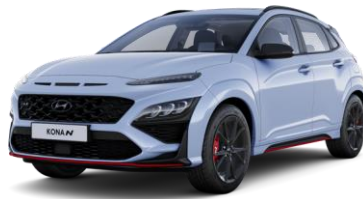
Performance Blue (SFB) erikoisväri