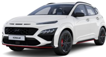
Atlas White (SAW) erikoisväri

Metalli-, helmiäis- tai erikoisvärin autoveroton ovh 500 € + arvioitu autovero 189 € = ovh 679 €