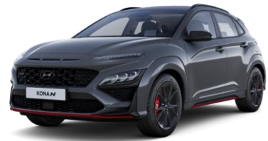
Dark Knight (Y7G) helmiäisväri