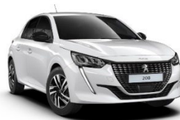
P0WP | Ice Pack White (valkoinen)