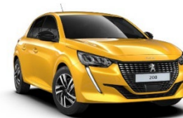
M02T | Faro Yellow (keltainen)