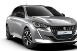
M0F4 | Artense Grey (harmaa)