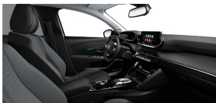
A6FX | Cosy | Allure Pack