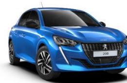
M65M | Vertigo Blue (sininen)