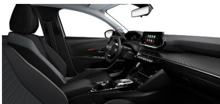
A5FX | Pneuma 3D | Active Pack