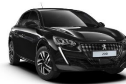
M09V | Perla Nera Black (musta)