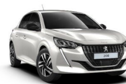
M6N9 | Pearl White (valkoinen)