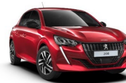
M5VH | Elixir Red (punainen)