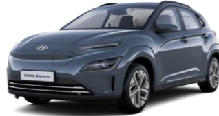
Dark Teal (TG8) -metalliväri