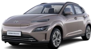
Silky Bronze (B6S) -metalliväri