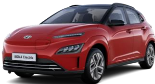
Sunset Red -helmiäisväri / Phantom Black -katto (WRT)