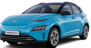
Dive In Jeju / Phantom Black -katto (UT1)