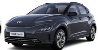
*Dark Knight Gray -helmiäisväri / Phantom Black -katto (YG1)