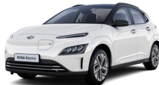
Serenity White - helmiäisväri / Phantom Black -katto (W6E)