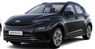
*Phantom Black (PAE) -helmiäisväri Abyss Black (A2B) -helmiäisväri