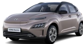
Silky Bronze -metalliväri / Phantom Black -katto (B6A)

Autoveroton hinta ja kokonaishinta sisältävät arvonlisäveroa 24 % verokannan mukaisesti. Autovero ei sisällä arvonlisäveroa. Kokonaishinta on pyöristetty euron tarkkuuteen. Sähköautojen kulutuksen ja toimintamatkan mittaustavan (WLTP) ilmoitetut arvot on tarkoitettu eri automallien väliseen vertailuun. Ne perustuvat keskiarvoarvoon jäljittelevään WLTP (Worldwide harmonised Light-duty Vehicles Test Procedure) -mittaukseen, eivätkä ne kuvaa auton kulutusta kaikissa olosuhteissa. Auton kulutukseen ja toimintamatkaan sähköllä vaikuttavat muun muassa lämpötila, keli- ja ajo-olosuhteet, kuljettajan ajotapa, ajonopeus sekä auton kuormaus. Kylmissä olosuhteissa sähköauton toimintamatka lyhenty huomattavasti ja hetkellisesti kulutus voi olla jopa moninkertainen ilmoitettuun WLTP lukemaan verrattuna. Latausteho ja -aika voivat vaihdella ilmoitetusta ohjearvosta. Latausteho ja -aika riippuvat esimerkiksi käytetystä latauspisteestä, auton sisäisen laturin tehosta ja voiko se hyödyntää yhtä vai kolmea vaihetta, kiinteistön sähköliittymän kapasiteetista, lämpötilasta, akuston lämpötilasta ja peräkkäisten latausten tiheydestä. Erityisesti talviolosuhteissa pikalataus saattaa hidastua huomattavasti. Omamassa on autoyksilökohtainen ja siihen vaikuttaa varustetaso sekä mahdolliset tehdaslisävarusteet.