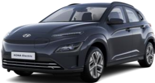
*Dark Knight (YG7) -helmiäisväri