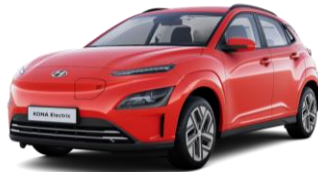
Engine Red (JHR) -erikoisväri