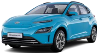
Dive In Jeju (UTK) -veloitukseton väri