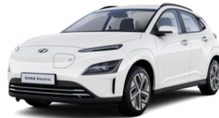
Atlas White (SAW) -erikoisväri