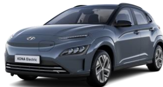
Dark Teal -metalliväri / Phantom Black -katto (TG1)