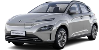
Shimmering Silver (R2T) -helmiäisväri