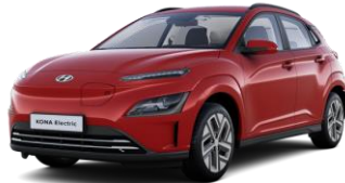
Sunset Red (WR6) -helmiäisväri