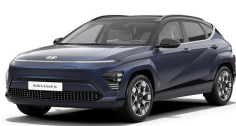
Sailing Blue Pearl / Black roof (U2P)