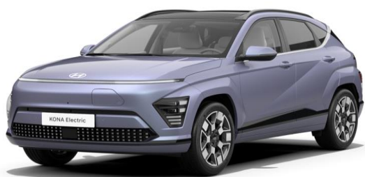
Meta blue Pearl (PM2)