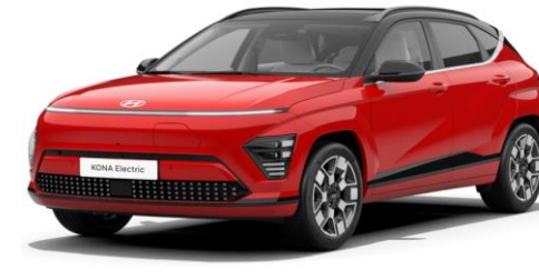
Engine Red Solid * / Black roof (JH0)