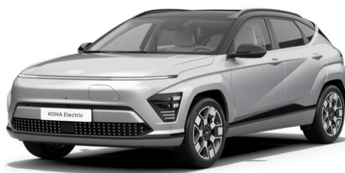
Shimmering Silver Metallic / Black roof (R20)