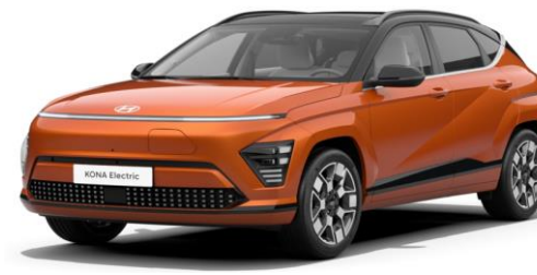
Jupiter Orange Metallic / Black roof (PL0)