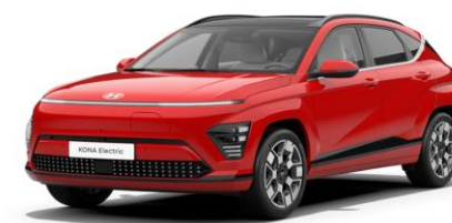
Engine Red Solid (JHR) *