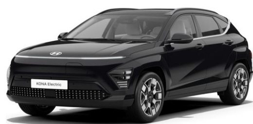
Abyss Black Pearl (A2B)

Metalli-, helmiäis- ja erikoisväri 590 € (* Engine Red - väri veloitusetta) Phantom Black - musta katto 650 €