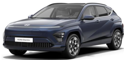
Sailing Blue Pearl (U2P)