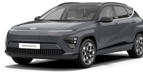
Ecotronic Gray Pearl (PE2)