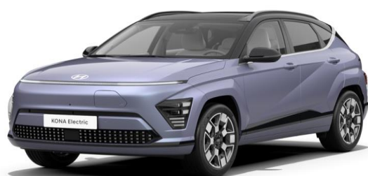
Meta blue Pearl / Black roof (PM0)