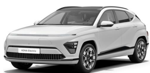
Atlas White Solid (SAW)