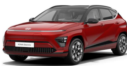
Ultimate Red Metallic / Black roof (R20) SOP 02.2024