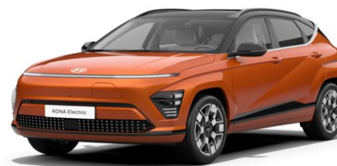
Jupiter Orange Metallic (PL2) SOP 04.2024