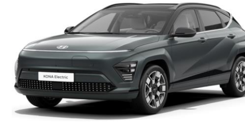
Cypress Green Pearl / Black roof (T20) SOP 04.2024