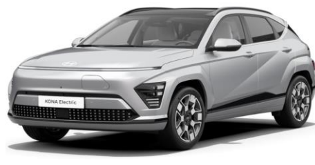
Shimmering Silver Metallic (R2T)