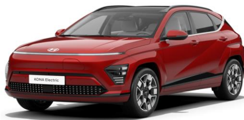
Ultimate Red Metallic (R29) SOP 02.2024