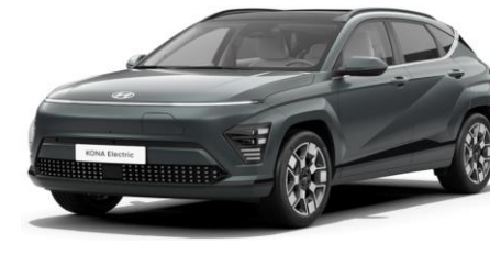
Jupiter Orange Metallic (PL2) SOP 04.2024