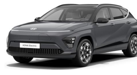
Ecotronic Gray Pearl / Black roof (PE0)