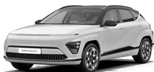
Atlas White Solid / Black roof (SA0)