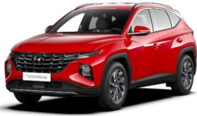
Engine Red (JHR) -vakioväri ilman lisähintaa