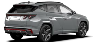
Shadow Gray/ Phantom Black -katto (TK1) (Saatavilla vain N Line -malliin)