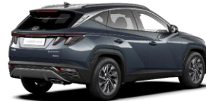
Teal/ Dark Knight -katto (TG1)