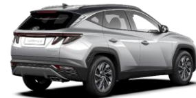
Shimmering Silver/ Dark Knight -katto (R2C)