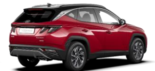
Sunset Red/ Phantom Black -katto (WRT)