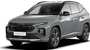
Shadow Gray (TKG) -erikoisväri (Saatavilla vain N Line -malliin)