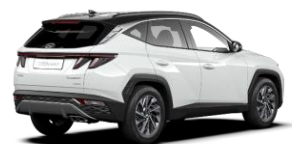
Serenity White (W6E) -helmiäisväri / Phantom Black -katto