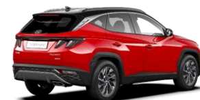
Engine Red/ Phantom Black -katto (JH1)