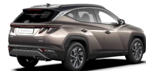
Silky Bronze/ Dark Knight -katto (B6C)