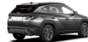
Amazon Gray/ Phantom Black -katto (A51)