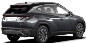
Dark Knight/ Phantom Black -katto (YG1)