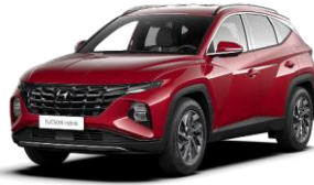
Sunset Red (WR6) -helmiäisväri