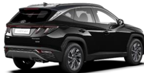
Phantom Black/ Dark Knight -katto (PA9)