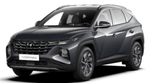
Dark Knight (YG7) -helmiäisväri